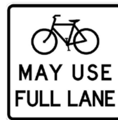
Carril Compartido de Ciclistas y Automovilistas