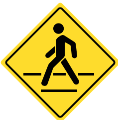
Cruce de Peatones